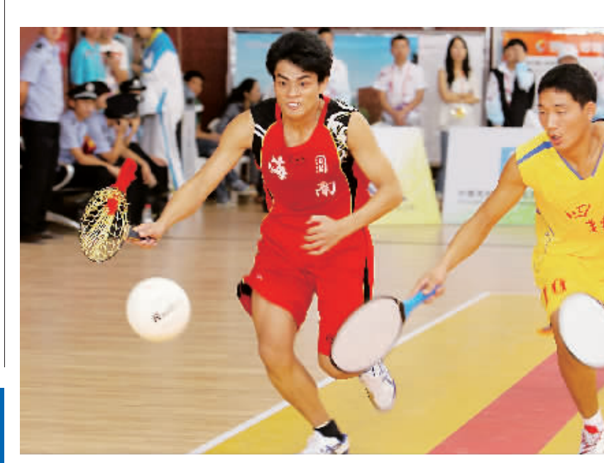
9月10日,在贵阳市进行的第九届民族运动会珍珠球首轮比赛中,海南队31:39负于四川队。图为海南队队员与四川队员在夺球。

我省134名参赛运动员将参加龙舟、珍珠球、射箭、陀螺、押加、高脚竞速、板鞋竞速、武术、木球、蹴球、独竹漂等11个竞技项目和3个综合技巧类表演项目的比赛。参赛选手近九成是我省大学和中学学生,其余选手为公务员和农民。海南代表团团长、副省长符跃兰出席开幕式。本届运动会由国家民族事务委员会、国家体育总局主办,贵州省政府承办。