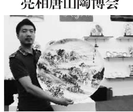
9月16日,全国最大骨瓷座盘在第14届中国唐山陶瓷博览会上亮相。该座盘直径达到了25寸,刷新了此前全国骨瓷座盘20寸的记录。