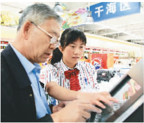
9月20日,一名顾客(左)在超市工作人员的帮助下使用肉品质量安全信息追溯查询机查询所购猪肉的相关信息。

日前,为健全肉品信息追溯体系,提高居民食品安全保障水平,山东省潍坊市在市区大中型商场、超市安装了肉品质量安全信息追溯查询机。消费者只需输入所购肉品包装上的条形码信息,即可自助查询所购肉品养殖、屠宰和销售方的相关信息。