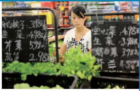
在兰州市张掖路菜市场,一名蔬菜经营者在自己销售的蔬菜摊位上标明价格。从9月13日起,兰州市采取临时价格干预措施限制蔬菜价格。

江西:猪肉蔬菜价格上涨明显 近期,江西蔬菜价格上涨明显,猪肉零售价格本周继续上涨,环比上涨1.11%。目前江西猪肉市场供应充足,但受国庆节来临影响,猪肉市场需求量也将逐步放大,预计近期江西猪肉价格仍将有小幅走高的压力。