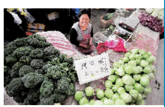
在兰州市张掖路菜市场,一名蔬菜经营者在自己销售的蔬菜摊位上标明价格。从9月13日起,兰州市采取临时价格干预措施限制蔬菜价格。

江西:猪肉蔬菜价格上涨明显 近期,江西蔬菜价格上涨明显,猪肉零售价格本周继续上涨,环比上涨1.11%。目前江西猪肉市场供应充足,但受国庆节来临影响,猪肉市场需求量也将逐步放大,预计近期江西猪肉价格仍将有小幅走高的压力。