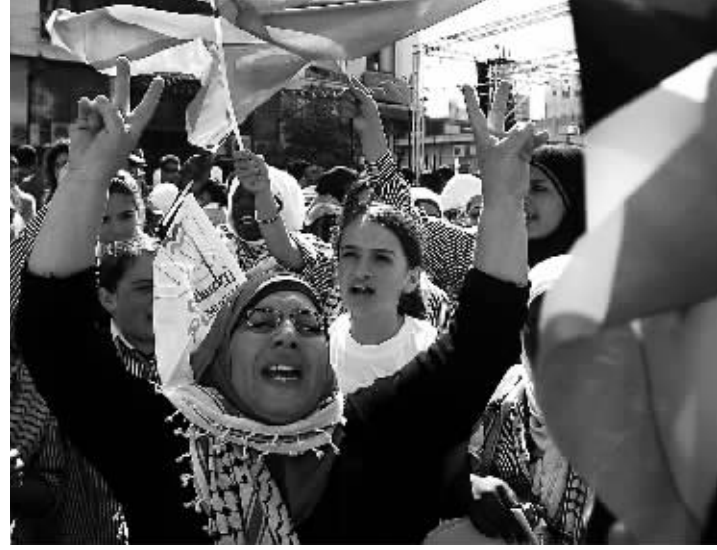
9月21日,在约旦河西岸城市拉马拉,巴勒斯坦民众集会支持巴勒斯坦加入联合国的计划。

在巴勒斯坦向联合国安理会提交会员国资格申请的最后关头,以色列和美国的外交努力趋于白热化,试图在最后一刻挡住巴勒斯坦的“入联”脚步。美国总统奥巴马21日会见以色列总理内塔尼亚胡时,重申美国不支持巴单方面向联合国寻求完全会员国资格。内氏也再次强调反对立场,呼吁“谈判实现和平”。分析人士认为,巴勒斯坦“入联”努力面临巨大阻力,难以成功,短期对以色列的实际影响有限。但这一举动将进一步挤压以色列在世界范围的外交空间;而面对周边逐渐高涨的反对情绪,在中东剧变下深感战略形势恶化的以色列更是如坐针毡。