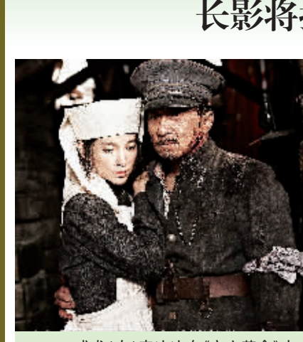
成龙(右)李冰冰在《辛亥革命》中

本报海口9月26日讯 (记者卓兰花) 由长影集团出品的史诗巨制《辛亥革命》23日起在全国拉开公映序幕。上映4天以来,各地票房佳绩频传,北京、上海、广州、海南等地院线都为影片提供了大量排片场次。