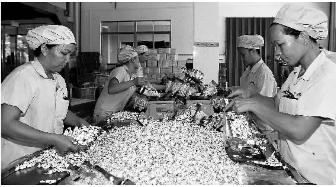
海南文昌市春光食品有限公司,工人在包装以椰子加工的椰子糖。

5颗槟榔干果经过6天时间、12道工序的深加工、包装之后,身价即从1元钱变为35元,产品附加值陡增。 这是发生在万宁市的故事。通过与湖南口味王集团联姻,2010年1月才注册成立的海南口味王科技发展有限公司,仅用10个月就实现了从选址到投产的全过程,让槟榔的价值实现了梦幻般的跳跃。该公司今年将实现产值1亿多元。