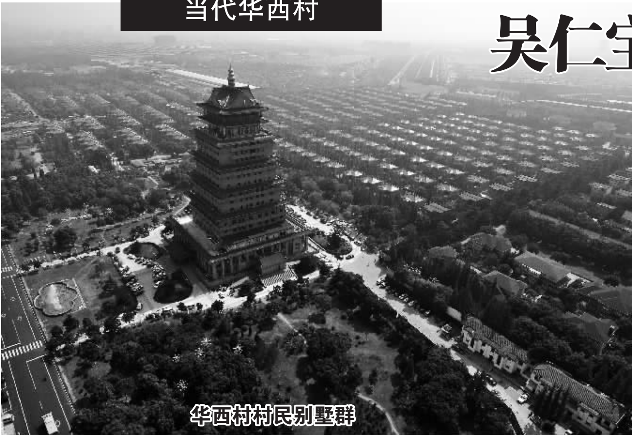
华西村村民别墅群

这是航拍的华西村金塔及周边村民别墅。江苏省江阴市华西村经过50年的艰苦创业、改革发展，华西村从一个名不见经传的穷村，成为年销售收入超过500亿元、人均收入8.5万元的富裕村庄，被誉为“天下第一村”和社会主义新农村建设的一面光辉旗帜。