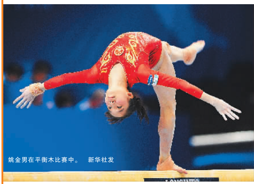
姚金男在平衡木比赛中 新华社发