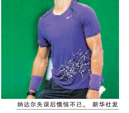
纳达尔失误后懊恼不已

本报讯10月13日,在总奖金为525万美元的ATP1000系列赛上海大师赛第三轮较量中,头号种子纳达尔以6:7(5)/3:6不敌28岁的德国老将梅耶尔,爆冷无缘八强。