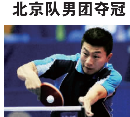
马龙在比赛中回球

据新华社南京10月13日电(记者王恒志)2011年乒乓球全国锦标赛13日全部结束,在最后的男团决赛中,马龙独得2分,帮助北京队3:1击败王励勤领衔的上海队,获得冠军。