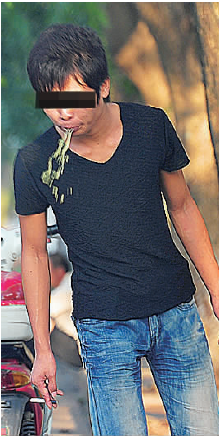
10月23日,海口市金盘路与金星路的十字路口附近,一行人在乱吐。