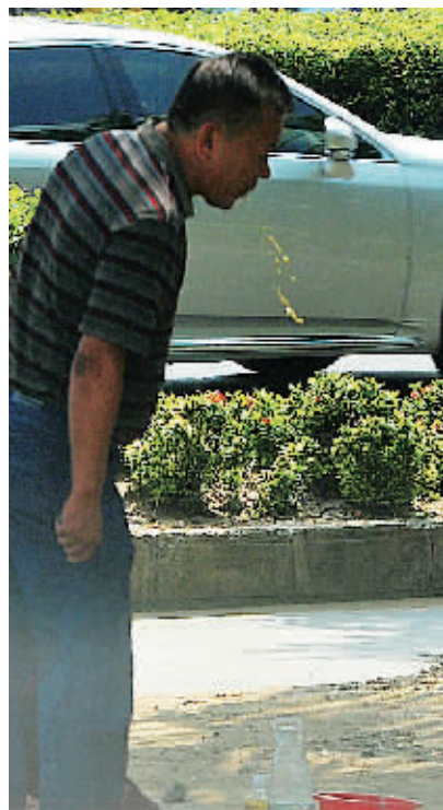
10月23日,海口市南海大道明光大酒店前的槟榔摊点,一行人在乱吐。