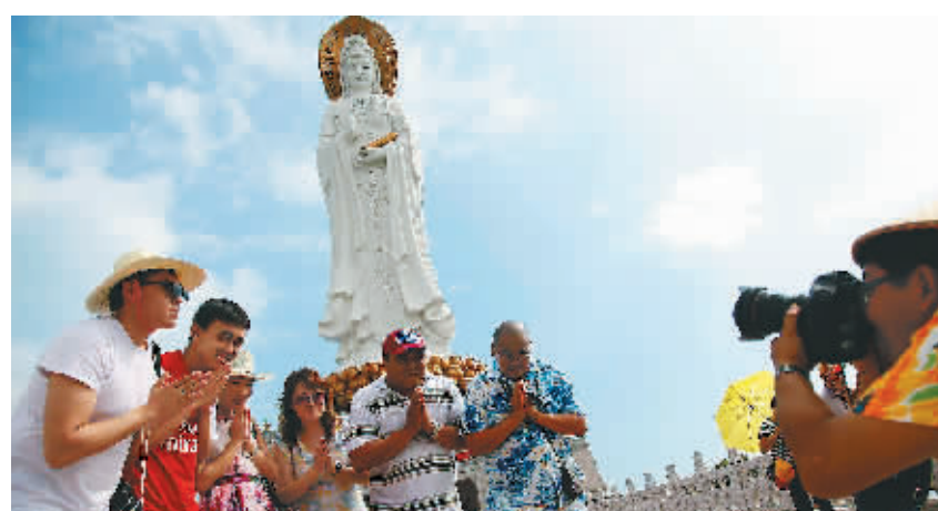
蒙古国新闻代表团访问三亚

原则上每座搅拌站单座年设计产能在60万—90万立方米,单座设计生产能力根据当地实际需求确定,原则是年生产能力能够满足市场需求,但不能高于市场需求的2倍以上。