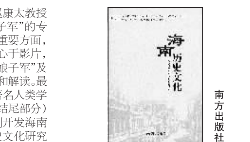
海南历史文化 南方出版社

第三,在文化研究方面。几位青年学者从海南黎族文化、地方文献的整理以及海南“非遗”的保护等方面进行了细致的分析和研究,这些文章不仅带有学术性,而且对于海南国际旅游岛的建