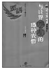
陈红兵 李晓虹 著 中信出版社

本书为央视《对话》节目系列丛书之一。《对话》节目因其独特定位和视角,往往能捕捉到重大经济事件中的历史意义,感触中国经济持续发展的脉动。