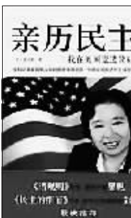
龚小夏 著 复旦大学出版社 2011年9月

龚小夏,北京大学历史系本科、硕士,哈佛大学社会学系博士。长期在美国从事教学、研究、媒体工作,熟悉美国政府各个部门以及民间机构的运作,并多次亲身参与各级政治竞选活动,对美国选举政治的具体操作有深入的了解。这本书全程记录了美籍华人如何竞选美国国会议员,展示了美式民主操作细节。此书受到了《民主的细节》作者清华大学副教授刘瑜的推荐,可配合起来一起看。