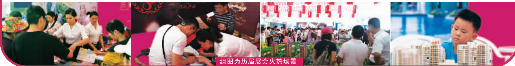
组图为历届展会火热场景