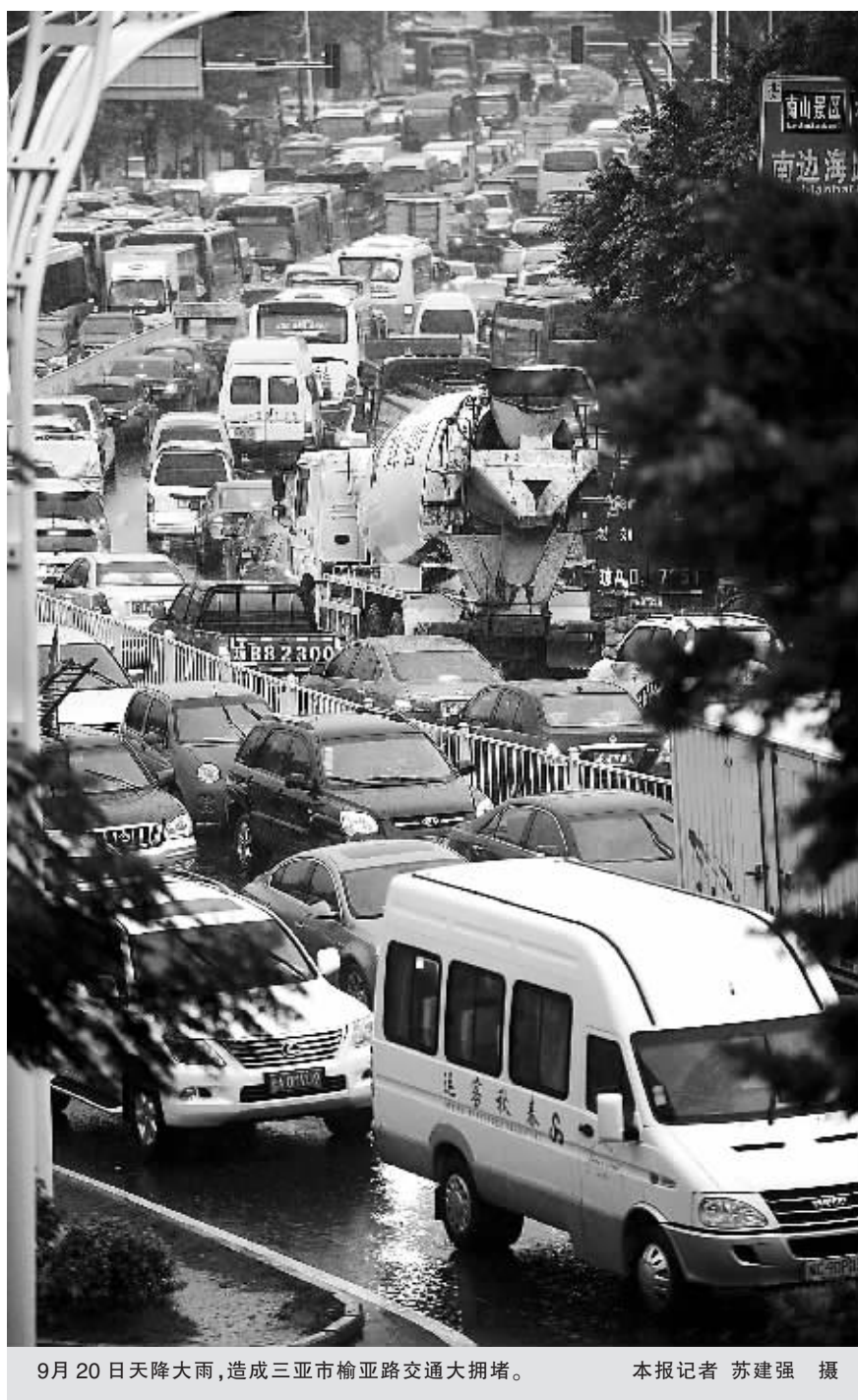
9月20日天降大雨,造成三亚市榆亚路交通大拥堵。