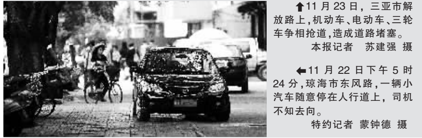
↑11月23日,三亚市解放路上,机动车、电动车、三轮车争相抢道,造成道路堵塞。