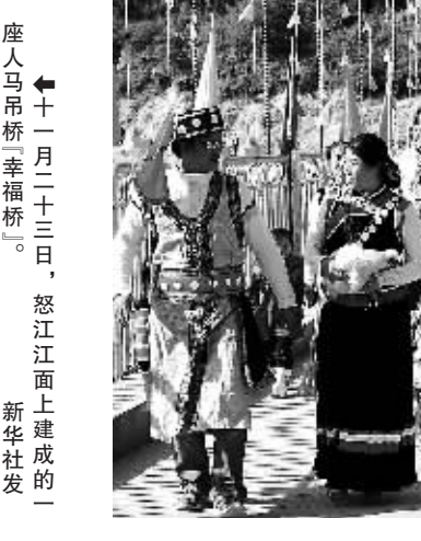
十一月二十三日，怒江江面上建成的座人马吊桥“幸福桥”。

在此间表示，这两座桥梁是怒江上实施大规模索改桥启事的示范工程，云南省此后将在境内300多公里长的怒江上，再建17座桥梁，全部由国家投资，将42对当地百姓过江的溜索，全部改建为桥梁，彻底结束怒江人溜索过江的历史。