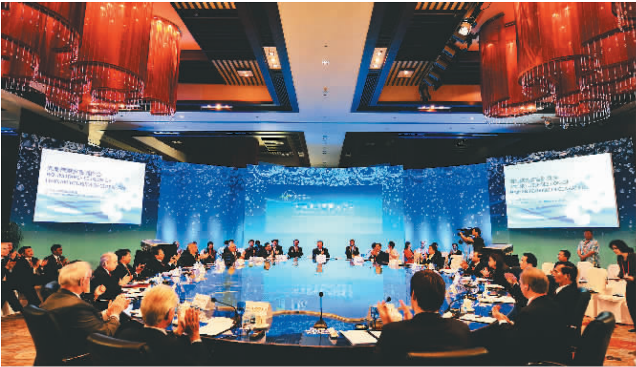
海南日益成为国际风云人物指点江山、碰撞智慧的重要平台。图为2010年博鳌国际旅游论坛主题论坛“海南旅游宣言圆桌会”现场。