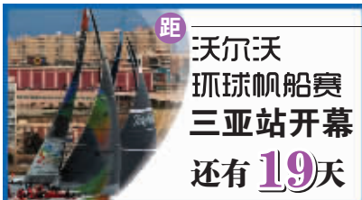
沃尔沃环球帆船赛三亚站开幕 还有19天

据了解,两年来,海口海关先后为海天盛筵、海口游艇经济论坛、中国体育旅游博览会等大型知名会展活动提供个性化的监管措施,通过驻点监管等方式提供高效便捷通关服务。据统计,去年,海口海关办理入境参展商品备案通关总货值达1.2亿美元,比上年增长近2倍。