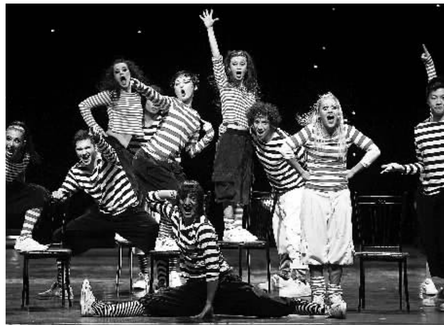
俄罗斯Todes现代舞团的大型舞蹈秀《魅惑无极限》海口剧照。

俄罗斯Todes现代舞团创建于1986年，共有40名演员，一直是已故流行天王迈克尔·杰克逊、玛利亚·凯丽、Lady Gaga、瑞奇·马丁等巨星演唱会的御用伴舞团，常在世界三大赌城之一的摩纳哥蒙特卡罗赌场歌剧院、美国拉斯维加斯赌场演出。据悉，首届“海口之春”旅游艺术节活动