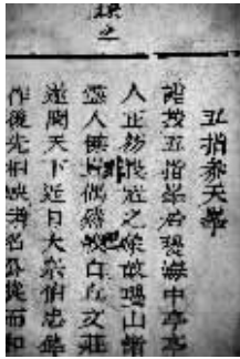
海南省档案馆收藏的线装书《南溟奇甸集》内页诗作。

作为“后七子”代表人物之一,王世贞倡导文学复古运动,认为“文必秦汉、诗必盛唐”,其诗歌取材赡博,纵心触象,都能化为诗料,形诸歌咏。较少模拟痕迹,能够意到调成,自然宛转。毛地林认为,此诗承袭王世贞的一贯诗文风格,应视为31首《桥头溪》诗中压卷之作。