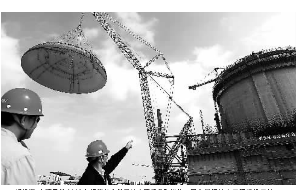
抓投资、上项目是2012年经济社会发展的主要任务和措施。图为昌江核电工程建设工地。

2012年是全面实施“十二五”规划的第二年,是国际旅游岛建设全面推进的重要一年。2012年我省经济社会发展的主要预期目标是:全省生产总值增长13%左右,地方公共财政收入增长20%,全社会固定资产投资增长28%,居民消费价格指数控制在5%左右,社会消费品零售总额增长18%,进出口总额增长17%,实际利用外资增长15%,万元地区生产总值能耗下降