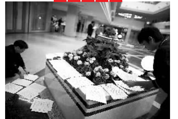
▲2月10日,两会简报组工作人员,在忙着整理委员们的发言简报。