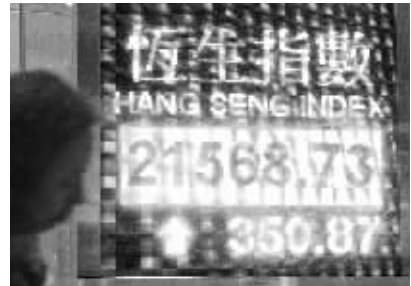
28日市民从香港湾仔一家银行的恒生指数电子显示屏前走过。

新浪财经股市观察员老艾认为,港股午后上涨将A股勉强拉红,但A股跟涨力度不大,说明还是有回调需求,蓝筹板块差不多也挨个涨过了,大家还是小心一点,暂时别急着操作,既然逢低买入,还是