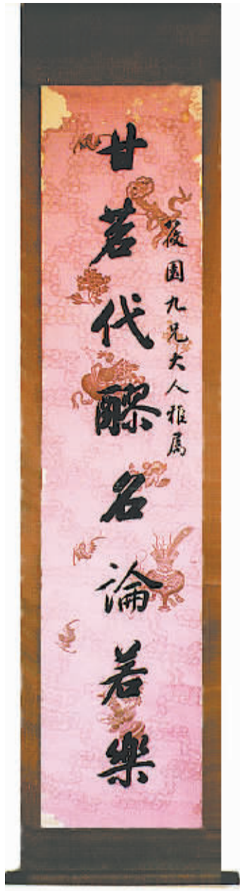
梁国琮书对联之上联

据黄古董后来说,这套民国版木盒精装《大学衍义补》藏品,两年后被广州一藏家重金买去,成为海南收藏界一大憾事。