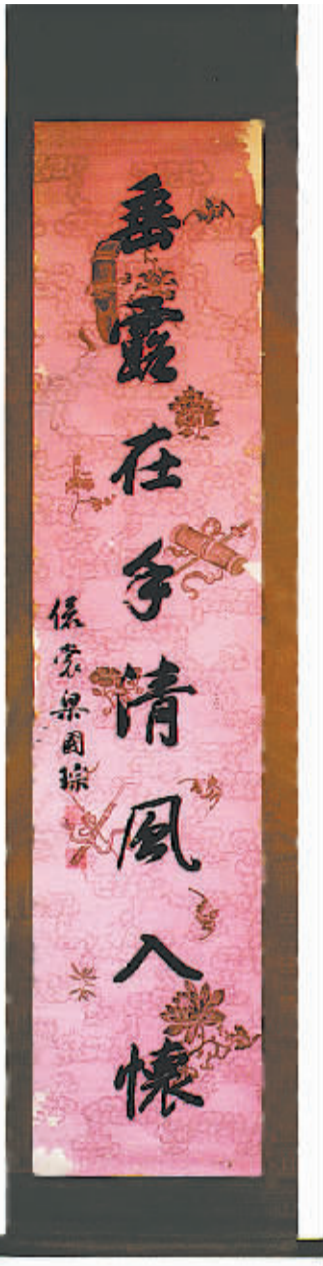
梁国琮书对联之下联