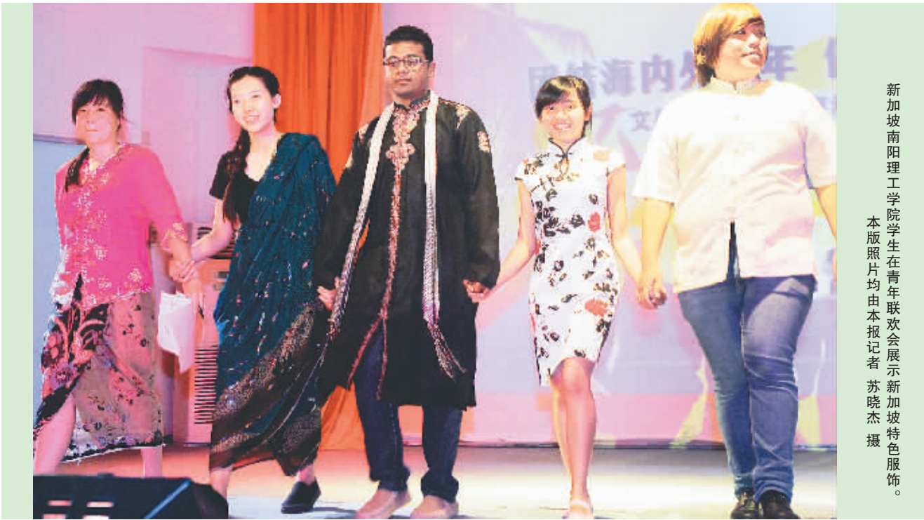
新加坡南阳理工学院学生在青年联欢会展示新加坡特色服饰。