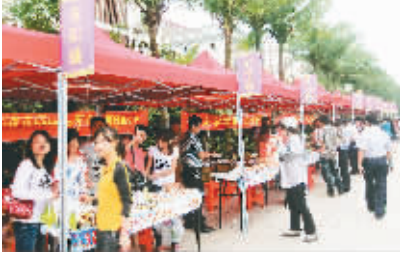
美食一条街吸引了众多海外文昌乡亲前来品尝家乡的小吃。

今天，来自马来西亚的华侨王■诚一早就在下榻的酒店门口，发现了一条临时搭建的文昌风味小吃一条街，让他有机会细细品尝地道的家乡小吃。