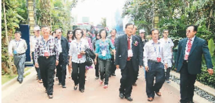
文昌逸龙湾度假中心参观。参加南洋文化节的嘉宾在