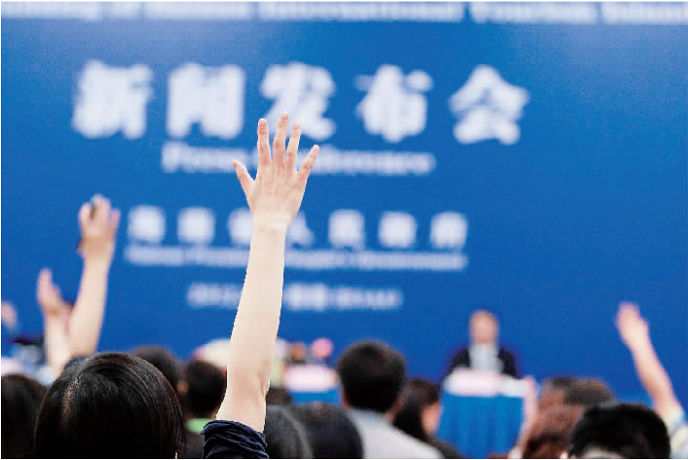
争先恐后 4月1日，海南省政府在博鳌召开海南国际旅游岛建设新闻发布会，图为会上举手“抢问”的媒体记者。