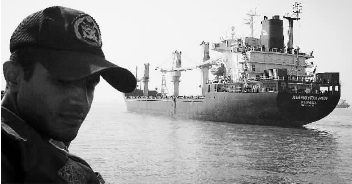
4月7日，在伊朗南部阿巴斯港附近海域，中国驻伊朗使馆慰问团乘坐的伊朗军舰靠近“祥华门”号货轮。

当地时间4月6日9时39分左右 示意图 1 8名海盗登船后，船长AKK/步炮，将驾驶室火力 2 18时30分左右 货轮成功获救 28名船员安然无恙 3 中国船员被海盗不备时，被劫持在海上 4 伊朗派出两艘军舰尾随跟踪 5 中国船员被海盗不备时，被劫持在海上 6 28名船员被劫持 7 28名船员被劫持 8 28名船员被劫持 9 28名船员被劫持 10 28名船员被劫持 11 28名船员被劫持 12 28名船员被劫持 13 28名船员被劫持 14 28名船员被劫持 15 28名船员被劫持 16 28名船员被劫持 17 28名船员被劫持 18 28名船员被劫持 19 28名船员被劫持 20 28名船员被劫持 21 28名船员被劫持 22 28名船员被劫持 23 28名船员被劫持 24 28名船员被劫持 25 28名船员被劫持 26 28名船员被劫持 27 28名船员被劫持 28 28名船员被劫持 29 28名船员被劫持 30 28名船员被劫持 31 28名船员被劫持 32 28名船员被劫持 33 28名船员被劫持 34 28名船员被劫持 35 28名船员被劫持 36 28名船员被劫持 37 28名船员被劫持 38 28名船员被劫持 39 28名船员被劫持 40 28名船员被劫持 41 28名船员被劫持 42 28名船员被劫持 43 28名船员被劫持 44 28名船员被劫持 45 28名船员被劫持 46 28名船员被劫持 47 28名船员被劫持 48 28名船员被劫持 49 28名船员被劫持 50 28名船员被劫持 51 28名船员被劫持 52 28名船员被劫持 53 28名船员被劫持 54 28名船员被劫持 55 28名船员被劫持 56 28名船员被劫持 57 28名船员被劫持 58 28名船员被劫持 59 28名船员被劫持 60 28名船员被劫持 61 28名船员被劫持 62 28名船员被劫持 63 28名船员被劫持 64 28名船员被劫持 65 28名船员被劫持 66 28名船员被劫持 67 28名船员被劫持 68 28名船员被劫持 69 28名船员被劫持 70 28名船员被劫持 71 28名船员被劫持 72 28名船员被劫持 73 28名船员被劫持 74 28名船员被劫持 75 28名船员被劫持 76 28名船员被劫持 77 28名船员被劫持 78 28名船员被劫持 79 28名船员被劫持 80 28名船员被劫持 81 28名船员被劫持 82 28名船员被劫持 83 28名船员被劫持 84 28名船员被劫持 85 28名船员被劫持 86 28名船员被劫持 87 28名船员被劫持 88 28名船员被劫持 89 28名船员被劫持 90 28名船员被劫持 91 28名船员被劫持 92 28名船员被劫持 93 28名船员被劫持 94 28名船员被劫持 95 28名船员被劫持 96 28名船员被劫持 97 28名船员被劫持 98 28名船员被劫持 99 28名船员被劫持 100 28名船员被劫持