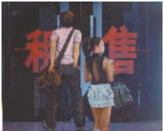
《向左转, 向右转》 (油画)

“井蛙不可以语于海者,拘于虚也;夏虫不可以语于冰者,笃于时也;曲士不可以语于道者,束于教也。” ——《庄子·秋水》