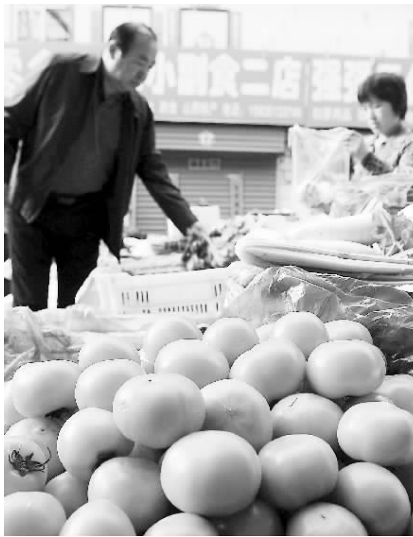
菜价明显上涨是3月份CPI反弹的一个主要因素。3月份全国鲜菜价格环比上涨6.1%,影响CPI环比上涨约0.21个百分点。