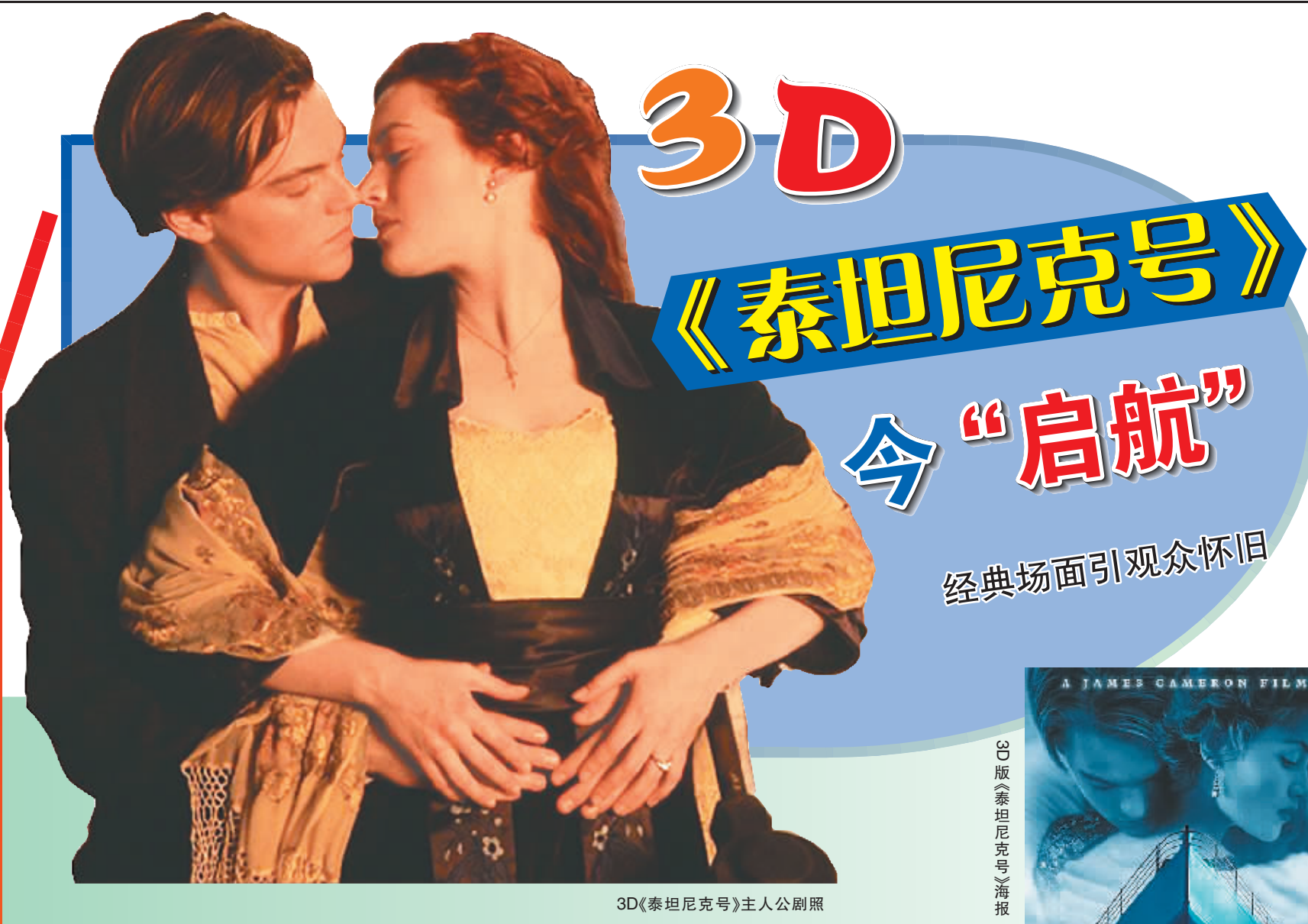
3D《泰坦尼克号》主人公剧照

南代表队,参加中国赛区的争夺。 由国家新闻出版总署主办的中国国际漫画节暨素有“华语动漫奥斯卡”美誉的金龙奖,自2004年开赛以来一直备受瞩目,成为全球华人动漫顶级权威赛事。2012年第9届金龙奖将先后在全国近20多个城市开赛,海南是首次参与全国联赛中。 本届动漫游戏嘉年华吸引了海南大学三亚学院101动漫社、琼山中学 OTAKU 动漫社、海口一中地平线动漫社、旭日动漫社等20多家本地动漫社团近千名选手参赛。届时将举办《上古战神记》官方代言海南选拔赛、动漫明星见面会等一系列精彩活动。