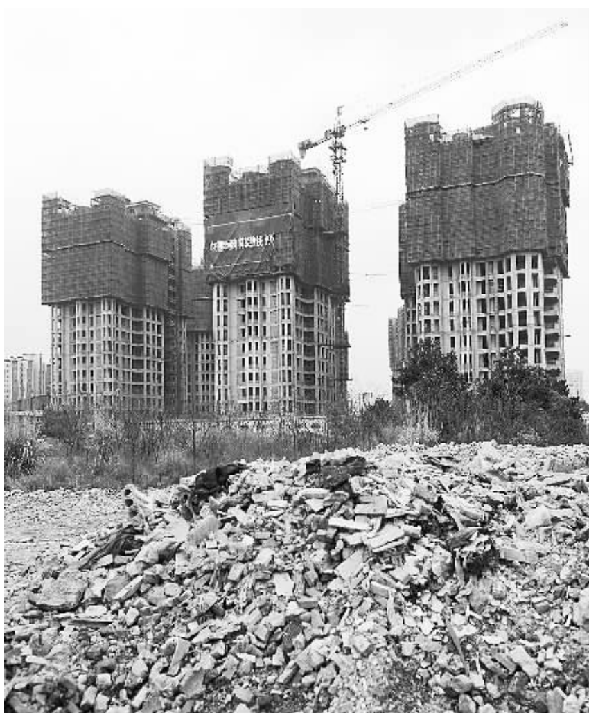
3月份,房价环比下降城市个数继续增多,东南沿海城市环比降幅也进一步扩大。图为日前拍摄的温州市区一处在建楼盘。据温州市房管信息网的公告,该楼盘降价幅度在30%至40%之间。

“3月份,我国70个大中城市新建商品住宅销售价格环比下降的城市有46个,比上月增加了1个。” 打开电脑,一边查阅国家统计局18日公布的楼市最新数据,一边刷新着新闻下方链接的各方分析评论,在北京一家金融单位工作的小穆很是纠结,中央政府不断释放的调控决心,让他觉得房价还会下降,而当前放缓的经济增速,首套房贷利率的松动,又令他担心楼市调控会放松,房价可能会出现报复性反弹。 事实上,和小穆一样,许多人心中都有这样的疑问:当前楼市调控是否已经到位?近日召开的国务院常务会议为何强调决不让房地产调控出现反复?未来调控走向如何?