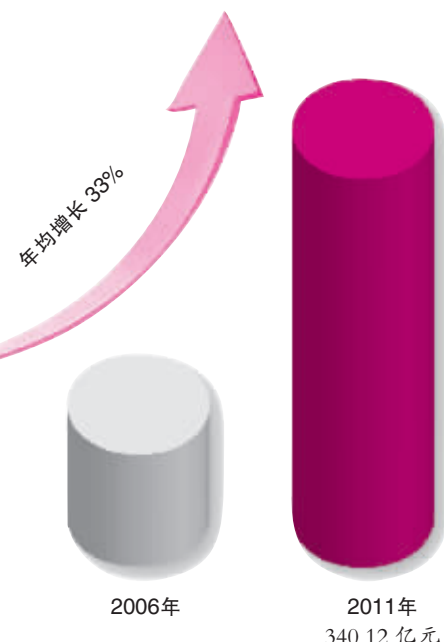
地方公共财政收入