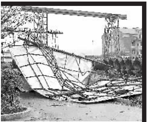
5 月 1 日在吉水县文峰镇朱山村拍摄的一块被大风吹倒的宣传牌。

4 月中旬以来的风雹、暴雨灾害共造成 11 市 70 县 124.1 万人受灾,因灾死亡 18 人,紧急转移安置和需紧急生活救助 7.3 万人,农作物受灾面积 849 千公顷,绝收面积 6.4 千公顷,倒塌和严重损坏农房 3900 户 10700 间,一般损坏 8867 户 21372 间。