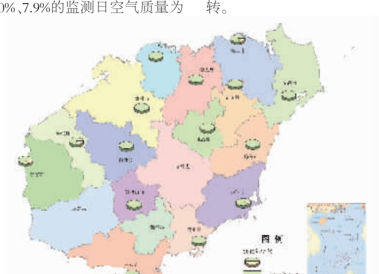
第一季度监测城市(镇)环境空气质量状况