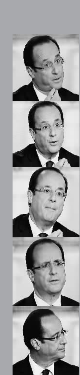
奥朗德在电视辩论中的表情拼图。

53%至54%的支持率领先萨科齐6至8个百分点 依旧保持领先优势 社会党总统候选人 弗朗索瓦·奥朗德 现任总统、人民运动联盟总统候选人 尼古拉·萨科齐 当地时间5月2日晚 两位总统候选人展开电视辩论 （5月6日举行第二轮总统选举投票前唯一的一场正面交锋） 双方各占用了72分17秒，在就业、税收、企业竞争力、移民政策、债务危机、欧洲建设、核能和国际等问题上进行了辩论 当晚的电视辩论与其说是一场竞选辩论，更像是一场“脱口秀” 落后局面未得到改观