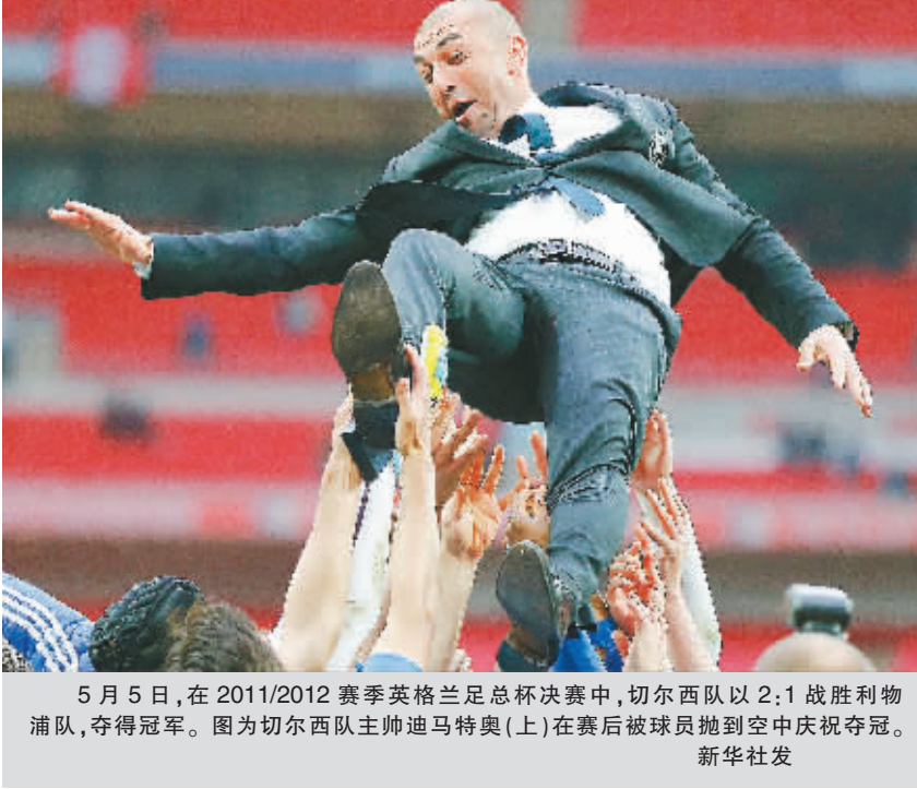
5月5日,在2011/2012赛季英格兰足总杯决赛中,切尔西队以2:1战胜利物浦队,夺得冠军。图为切尔西队主帅迪马特奥(上)在赛后被球员抛到空中庆祝夺冠。