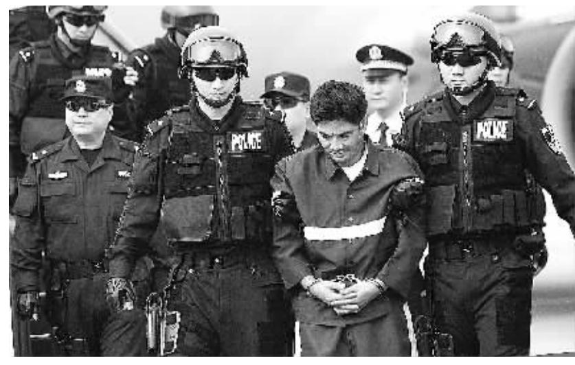
糯康被押解到北京。

5月10日上午,老挝万象机场,阳光万丈。 在这里,缅甸籍大毒梟、“金三角”特大武装贩毒集团的首犯糯康,由老挝警方正式依法移交中国警方。 证据显示,2011年13名中国船员遇害、震惊国际社会的湄公河“10·5”惨案,以及其他近30起针对中国船民和公民的特枪劫、杀人案件,与糯康犯罪集团有直接关系。 诸多血淋淋的真相,随着审讯的开始,可能很快大白于天下。在此之前,记者实地走访中国公安部专案组,深入“金三角”腹地,追溯案件侦办过程,还原那一惊心动魄、跌宕起伏的剿匪之战。