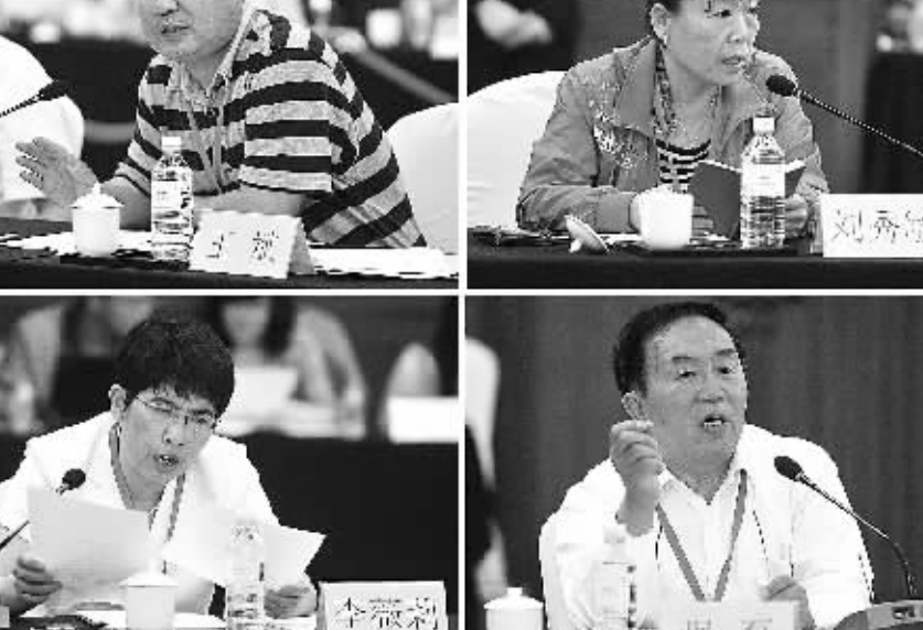
此次阶梯电价改革,各省区均按要组组织听证会,这也是近年来听证会召开最密集的时期。图为北京听证会现场。