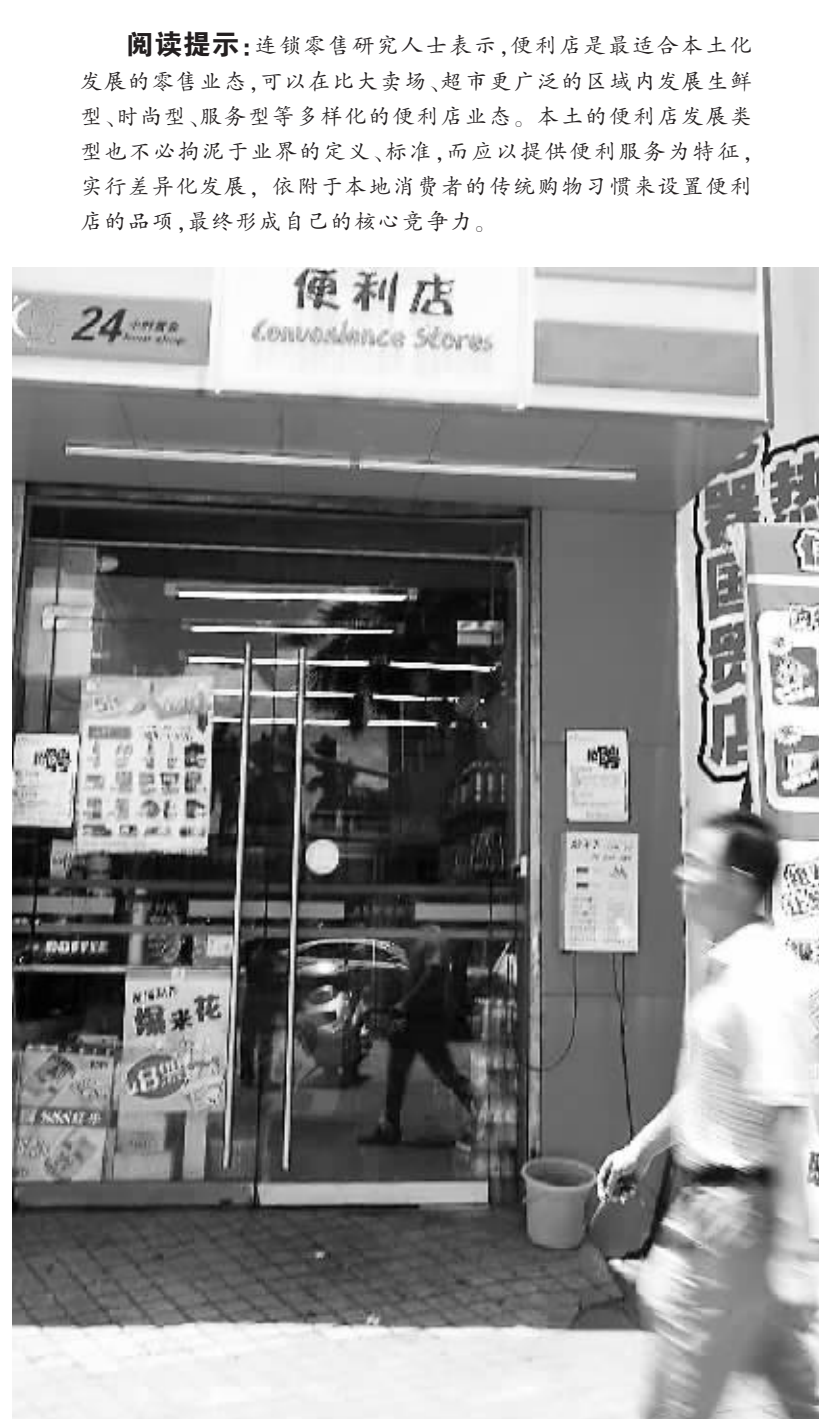
图为海口市国贸街头的一家24小时便利店。

“海口的城市气候和市民的生活习惯,决定了海口是一个夜间消费活跃的城市,海口社区商业发展在规划、服务、管理