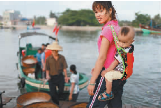
年轻妈妈带着一岁半的孩子在港口劳作谋生。渔家的孩子,从小就在母亲的背上见证着潮起潮落。