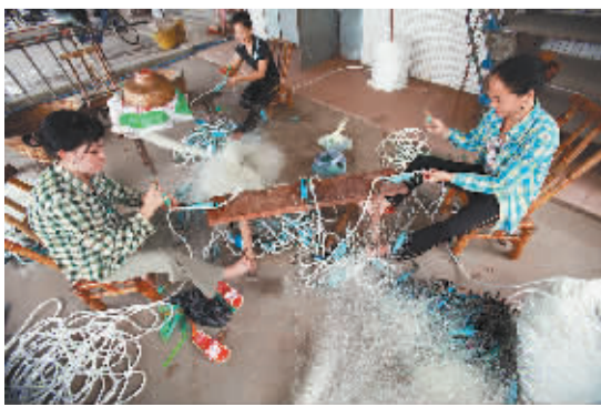
男人们休渔,女人们则忙着编织渔网。