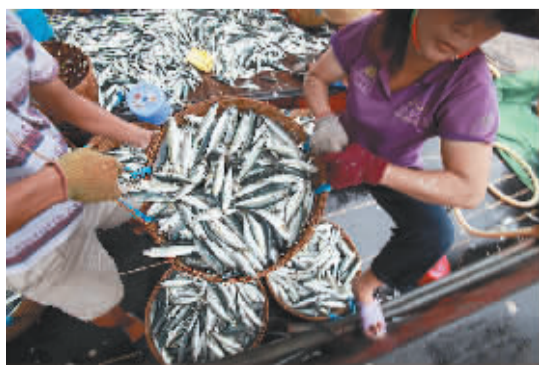
渔民在收获休渔前最后一船鱼。