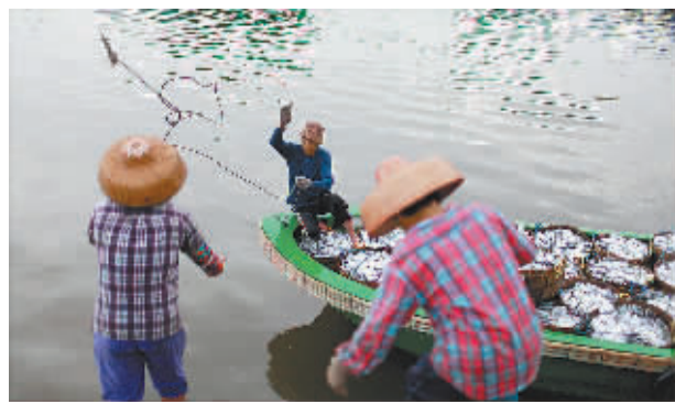
南海伏季休渔最后一天,潭门港渔民在收获休渔前最后一船鱼。