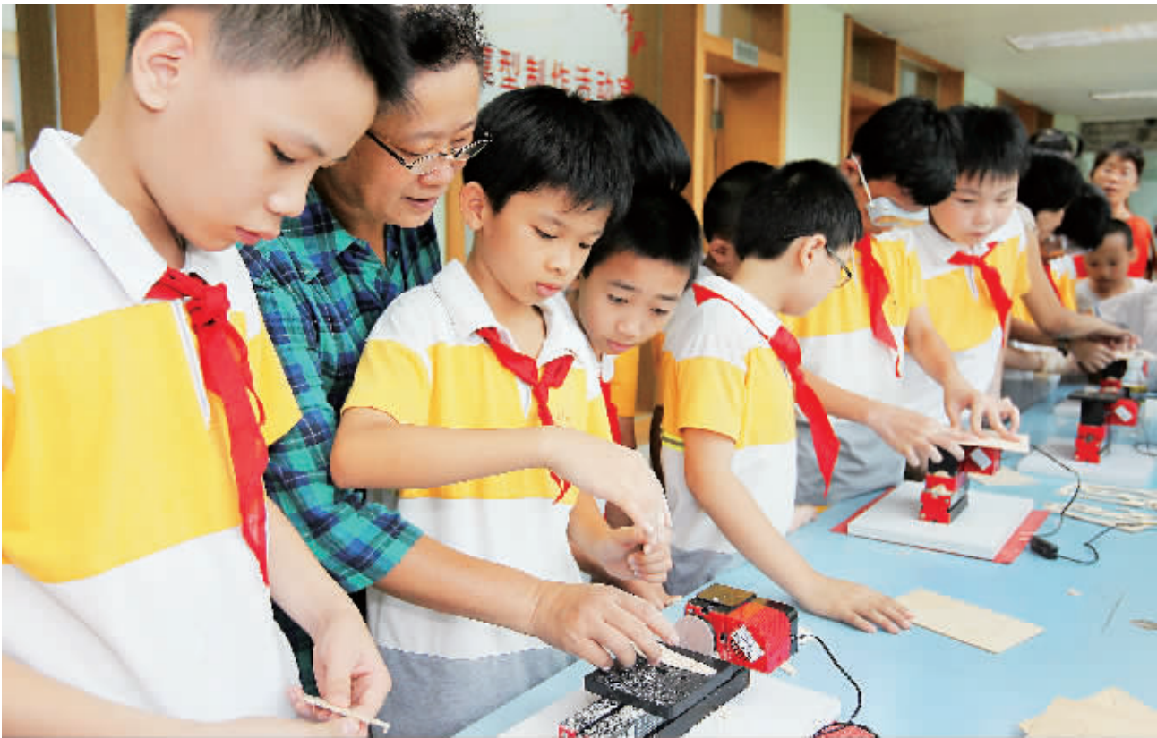
↑6月1日,孩子们在老师的指导下制作模型玩具。当日,省科学工作室面向社会免费开放,举办了“科技体验伴我快乐过六一”活动。