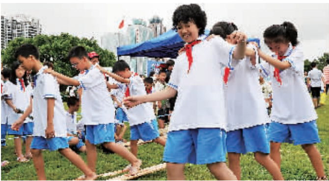
←6月1日上午,由海口市政府和安利公司等单位共同主办的海口万绿园“六一”安利环保嘉年华活动让孩子们乐翻天。