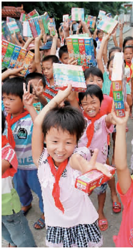
↑6月1日,南海网组织网友到定安县定城镇潭黎小学举行“六一”爱心游园活动。