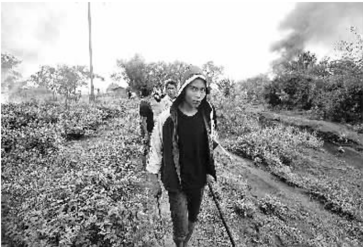
六月十日,在缅甸若开邦首府实兑,一名若开族男子携自制武器走过被烧毁的房屋。

一个国际刑事法院代表团 10 日抵达利比亚,与利比亚当局磋商,要求利比亚津坦地方武装释放国际法院律师团成员。津坦武装指认律师团成员涉嫌间谍活动,不让代表团与律师团会面。