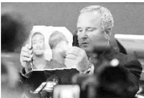
6 月 10 日,美国南部亚拉巴马州奥本市警察局展示犯罪嫌疑人照片。

金锦平说,辛格今年 4 月在给使馆的一封信中承诺当月底归还 570 万卢比,却再次失约。