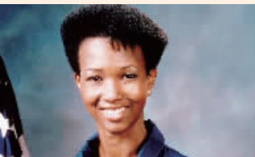
这是美国第一位黑人女宇航员梅·杰米森。她于1987年入选美国国家航空航天局进行太空飞行训练,1992年9月乘“奋进”号航天飞机完成了190多个小时的太空飞行。