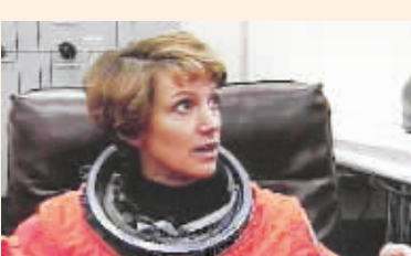
1995年2月3日,美国女宇航员艾琳·玛丽·柯林斯乘“发现”号航天飞机升上太空。柯林斯1999年7月成为有史以来第一位女航天员指令长。