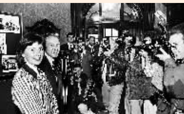
1991年6月8日,英国第一位进入太空的女宇航员海伦·莎尔曼在接受采访。1991年5月18日同两名前苏联宇航员乘“联盟TM-12”飞船升空,在和乎号轨道站上工作了8天后安全返回地面。