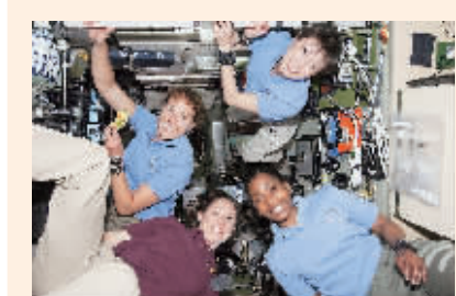
“发现”号航天飞机2010年4月5日升空,7日与国际空间站对接,“发现”号三名女宇航员与国际空间站一名女宇航员“会师”,创下同时身处太空女性人数最多的纪录。图为4名女宇航员合影。

据新华社电 载人航天工程总设计师周建平今天告诉记者,由于过去神舟飞船运输能力的限制,合作有限。随着能力的提高,国际合作可望进一步拓展,天宫二号上会有新的国际合作项目。今后建成空间站后,我们就更有能力给中外科学家提供一个可以从事太空探索和研究的、具备相当规模的平台,让他们去开展生物、材料、微重力、天文、地球环境等方面的科学研究。