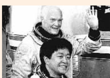
1998年10月29日,美国宇航局“发现”号航天飞机从佛罗里达州卡纳维拉尔角的肯尼迪航天中心发射升空。日本第一位女宇航员向井千秋(前)和美国宇航员格伦登上航天飞机。