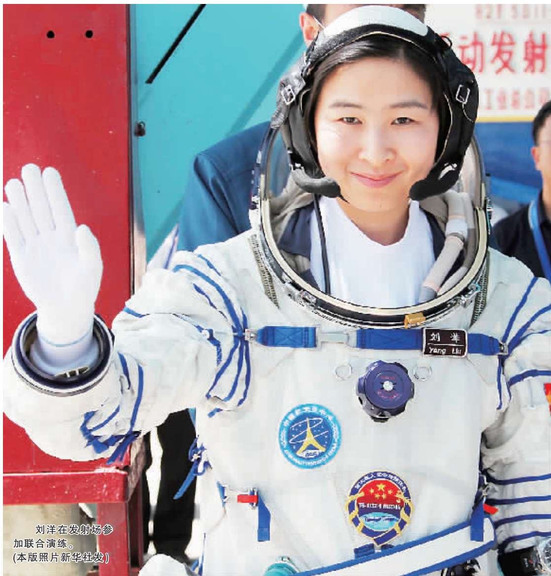
刘洋在发射场参加联合演练。