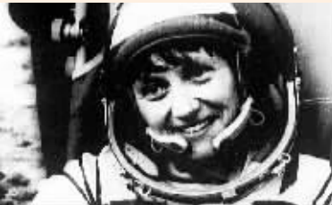
1984年7月30日,前苏联宇航员斯捷潘诺娃·萨维茨卡娅返回地面,从“联盟T-12”号飞船的宇宙密封舱走出。萨维茨卡娅成为第一个在太空行走的妇女,她也是第一个进行过两次太空旅行的妇女。