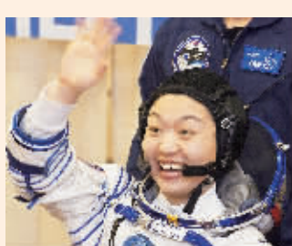
2008年4月8日,韩国的李素妍与俄罗斯宇航员一起乘坐俄“联盟TMA-12”号载人飞船从哈萨克斯坦的拜科努尔发射场升空,前往国际空间站。