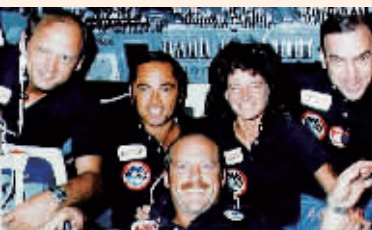
1983年6月,美国第一位进入太空的女宇航员莎莉·赖德(右二)在“挑战者”号航天飞机上与男同事们合影。