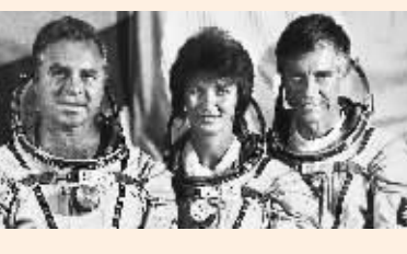
俄罗斯女宇航员叶·孔达科娃是世界上在宇宙中滞留时间最长的女宇航员。她于1994年10月4日乘“联盟-TM20”宇宙飞船和这两名宇航员一起到达和平号空间站,在太空飞行169天后于1995年3月22日返回地面。图为她与两名男宇航员合影。