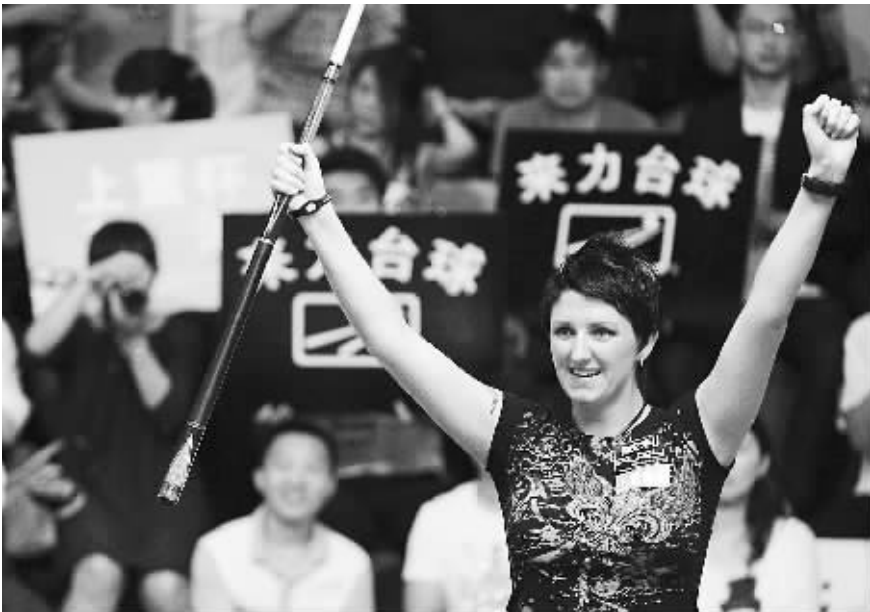
21日,在2012世界女子九球锦标赛决赛中,英国选手凯莉·费雪以9:6战胜中国选手手小芳,获得冠军。

东道主琼海队夺得了少年男子组和成年女子组的冠军,成为本届篮球比赛的大赢家。海口队获得四块银牌。少年女子组的金牌由澄迈队获得。