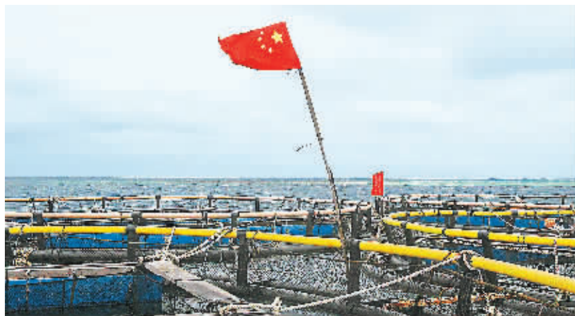
南沙群岛美济礁泻湖网箱养殖点,鲜艳国旗迎风飘扬。