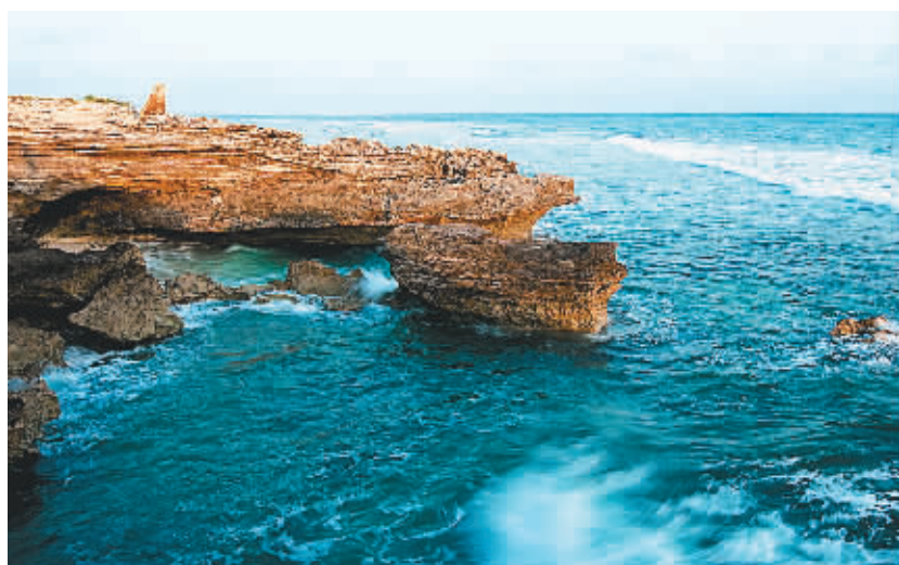
西沙永兴岛岛上的早晨。