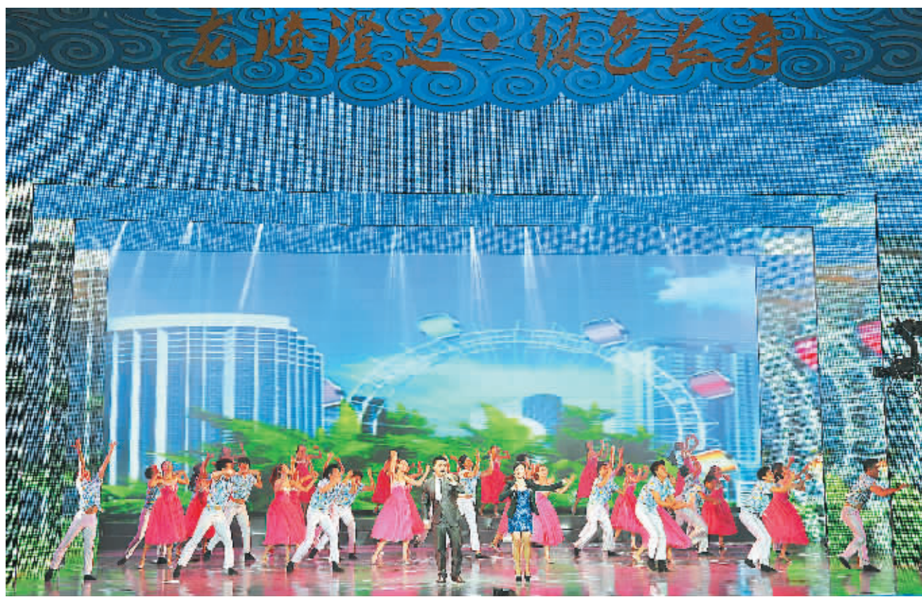
6月22日,《大海之声》海南澄迈原创歌曲及歌手电视大奖赛颁奖晚会在澄迈金江镇举行。