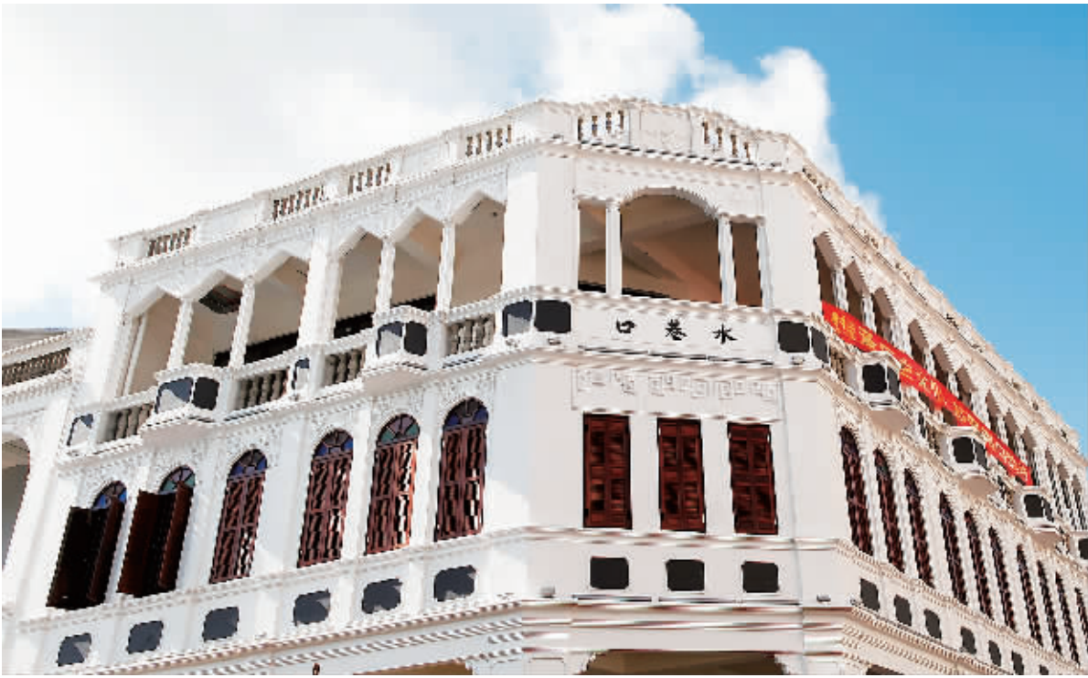
↑已完成主体和外立面施工的海口骑楼老街历史建筑。

本报海口 7 月 4 日讯 (记者宋国强) 海南日报记者今天在海口市水巷口看到,该市骑楼老街首批 10 幢历史建筑的主体修复工作完毕,即将对外招商。 根据“修旧如旧”的原则,在海口骑楼老街首批 10 幢历史建筑修复工作中,施工