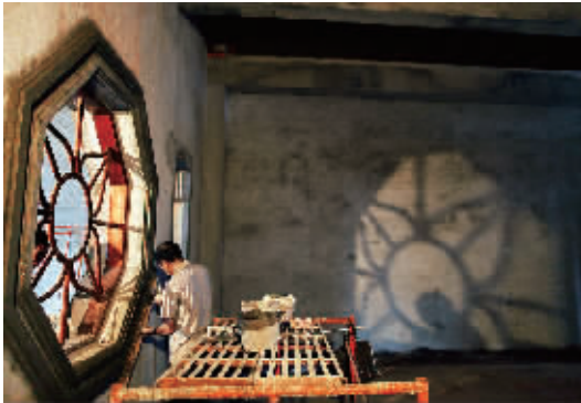
↑来自广东汕尾的老工匠在进行八角窗外圈的施工。

和蓝本,以达到传承和保护骑楼建筑文化的目的。 海口骑楼主要分布于海口市得胜沙路、中山路、博爱路、新华路、解放路、长堤路等 12 条老街区,370 多座骑楼建筑,其中最古老的建筑四牌楼至今有 600 多年历