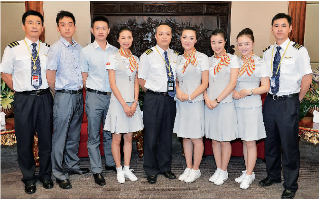
“6·29”反劫机英雄机组全体成员。

2012年6月29日，我作为海航集团天津航空 GS7554 航班机长，与另外8名机组成员一起执行和田至乌鲁木齐飞行任务。也正是在这一天，6名暴徒登上我们的飞机，企图暴力冲击驾驶舱制造劫机恐怖事件。在机组、旅客的共同努力下，与歹徒展开殊死搏斗，最终成功制服歹徒。GS7554