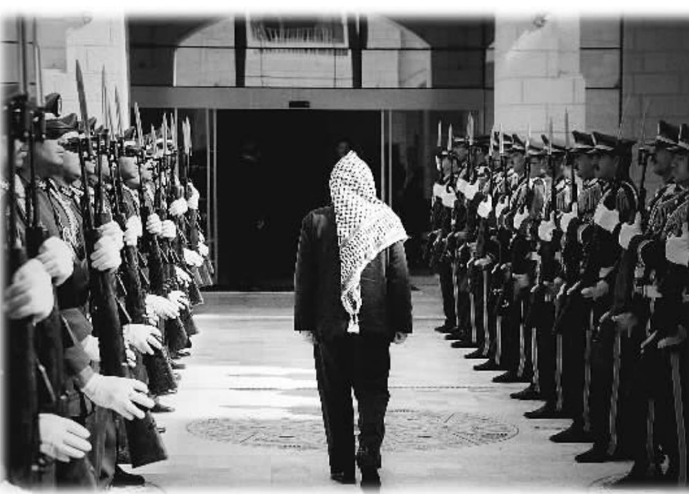
在约旦河西岸城市伯利恒拍摄的阿拉法特的背影(资料照片)。

针对她丈夫的阴谋,要抢班夺权。巴当局则指责她不满每月10万美元生活费,欲染指以阿拉法特之名的巴解存款,以方称这笔经费达13亿美元。阿拉法特的医生称他去世并非“医疗事件”,而是“政治事件”。巴新老派争斗中,阿拉法特的亲信、前安全高官达赫兰因走私武器罪遭开除出党,经济顾问拉希德以贪污罪判15年监禁,他在半岛台50分钟纪录片中多次指责巴当局。