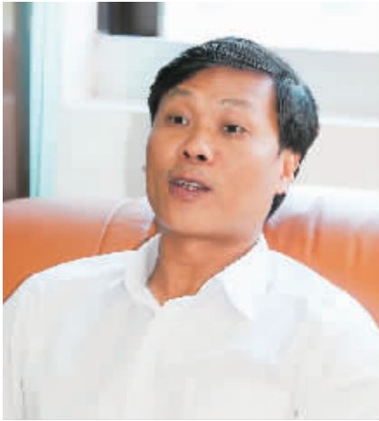
琼海市委书记符宣朝。

接受海南日报记者采访时表示，在省第六次党代会精神指引下，琼海将加快琼海—博鳌融合发展，充分发挥博鳌亚洲论坛的辐射作用，打造对外经济合作和文化交流的平台；建设博鳌乐城国际医疗旅游先行区、博鳌机场、琼海至文昌高速公路、博鳌新能源与智能电网总部基地、博鳌国际商务会展中心、极地公园、潭门中心渔港人工岛、博鳌宝莲城游艇俱乐部、嘉积城区万亩生态田野公园等项目；抓好绿化宝岛大行动；结合治理“庸懒散贪”活动狠抓干部的作风建设，为实现琼海绿色崛起发力。