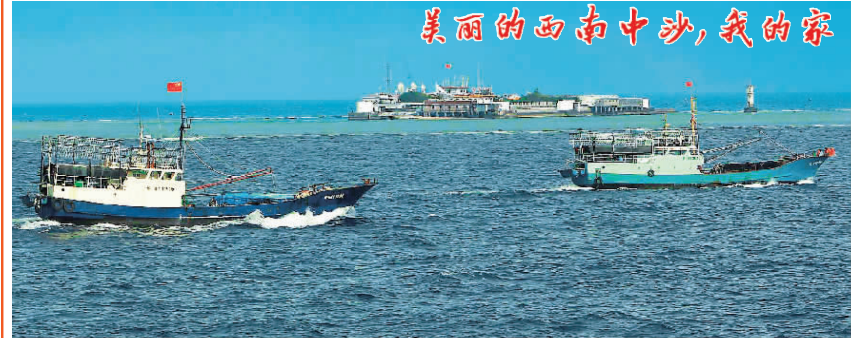
7月15日下午，我省捕捞船队抵达永暑礁海域。

将到达永暑礁时，中国渔政310船及时赶到现场开展护渔工作。南沙群岛位于中国南海的最南端，是南海诸岛中岛礁最多、散布范围最广的一圈圆形珊瑚礁群。南沙群岛领土主权属于中华人民共和国，行政管辖属中国海南省三沙市。