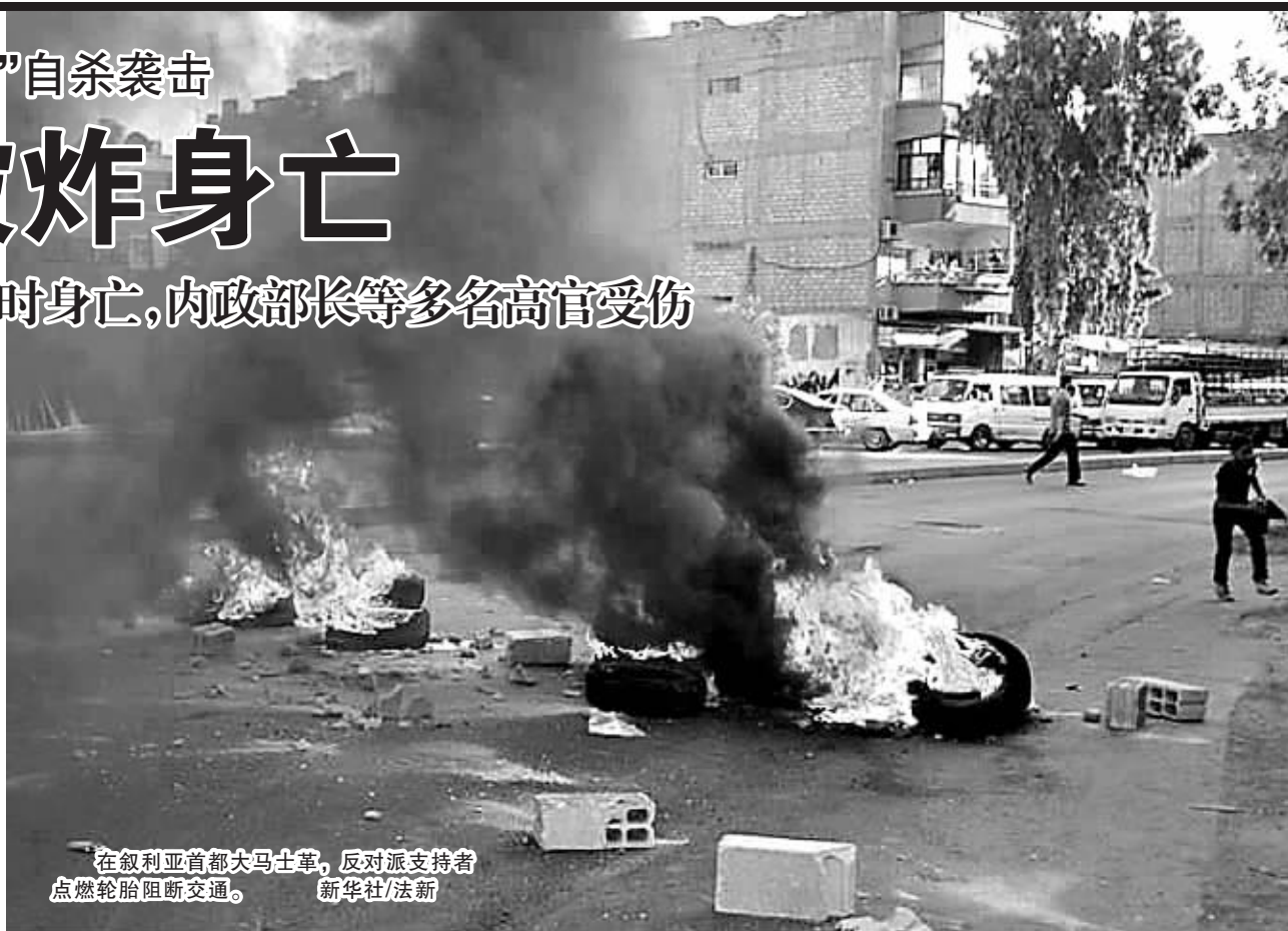
在叙利亚首都大马士革，反对派支持者点燃轮胎阻断交通。

新华社大马士革7月18日电(记者姜铁英)据叙利亚通讯社18日报道，位于首都大马士革的叙利亚国家安全总部当天上午遭到自杀式爆炸袭击，叙国防部长拉杰哈遇害身亡，另有多名政府高级官员受伤。 事发时，拉杰哈正在叙国家安全总部内与多名高级军事和安全官员开会。除拉杰哈外，叙利亚总统巴沙尔的姐夫、国防部副部长阿塞夫·舒卡特也在袭击中遇难。叙内政部长与其他多名高级官员受重伤。受伤官员已被送往附近一家医院接受治疗，医院已加强安保。 爆炸发生后，一个名为“伊斯兰旅”的反政府组织和叙反对派武装力量“叙利亚自由军”都宣称制造了这起爆炸袭击事件，并称这是对总统巴沙尔·阿萨德核心集团的一次胜利。 大马士革社会活动人士奥马尔·迪马什基告诉美联社记者，政府军精锐共和国卫队在沙米医院周围守卫。国家电视台随后报道，内政部长沙尔健康状况稳定。 总部设在英国的叙利亚人权观察组织和黎巴嫩塔塔电视台晚些时候说，国家安全局危机应对室主任图尔克马尼伤势不治。 国家安全局总部位于大马士革市中心，警戒森严。 路透社以一名不愿公开姓名的安全官员为消息源报道，袭击者是政府高层的一名“保镖”。