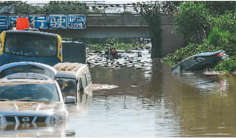
7 月 22 日，搜救人员在淹没的车辆间搜索。由于积水量大，作业时间长，北京市交通部门预计 23 日京港澳高速仍然无法通行。

尽管气象部门频繁发布暴雨预警信号，但微博上仍不乏对于暴雨突袭预警不足的“吐槽帖”。多位网友表示，暴雨发生前，他们只在交通广播和网络新闻中了解到 21 日北京将有暴雨，但对新闻中提及的蓝色、黄色、橙色暴雨预警信号背后所意味的具体灾害和严重程度一无所知。网民认为，在发布灾害预警时，应对颜色含义解释清楚，此外还应该给灾害涉及范围内的手机用户发短信，提醒居民尽量减少外出等。