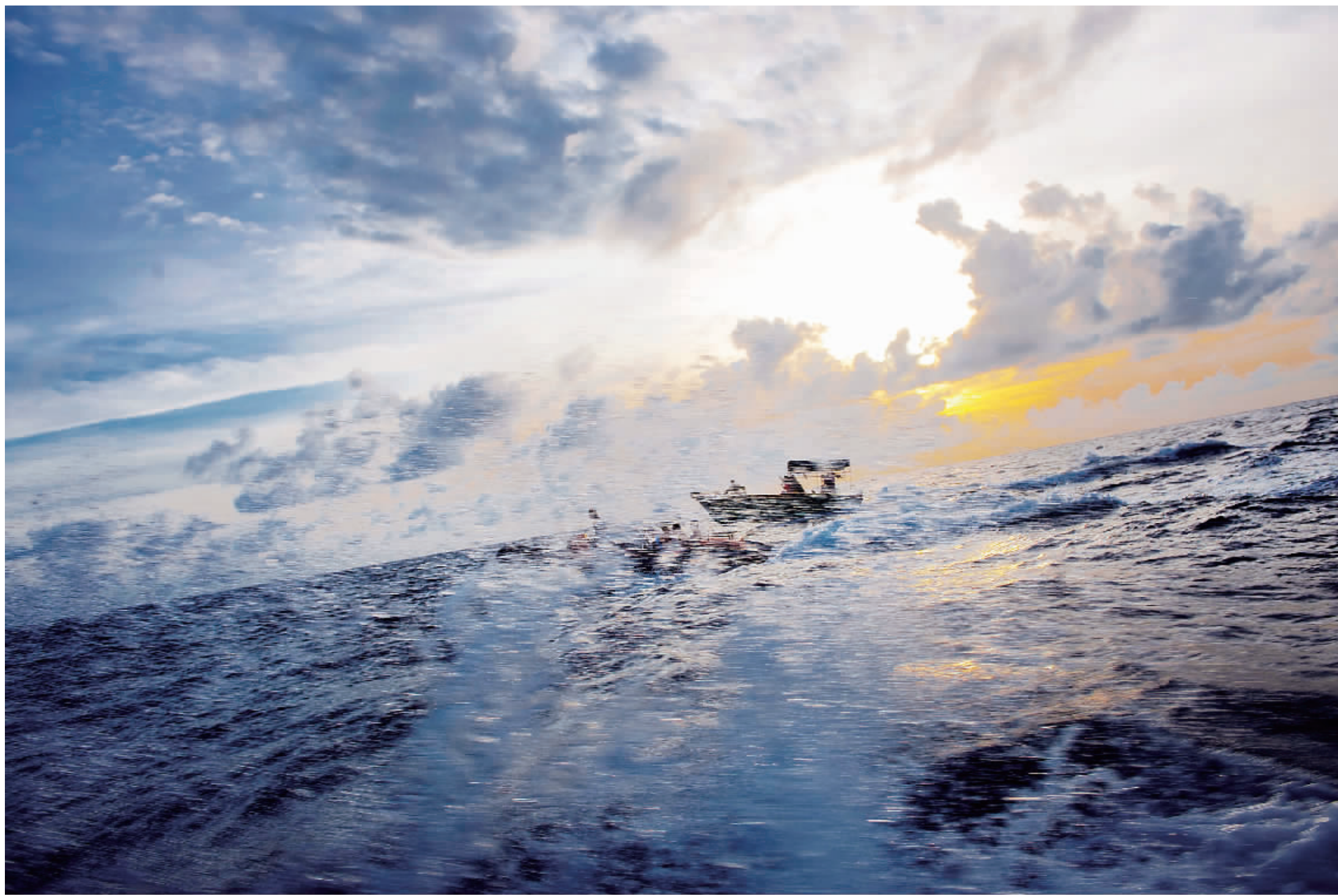
↑赵述岛海域霞光。

神秘美丽的南海,是我国最大最深的海洋,也是世界上最大最深的陆缘海之一。海域内岛屿、岛礁、礁盘、沙洲、暗沙、暗滩、潟湖等众多。南海浩瀚无边,它充足的光热资源、洁净的水质、丰富多样的海洋地理环境,为海洋生物提供了良好的栖息环境。