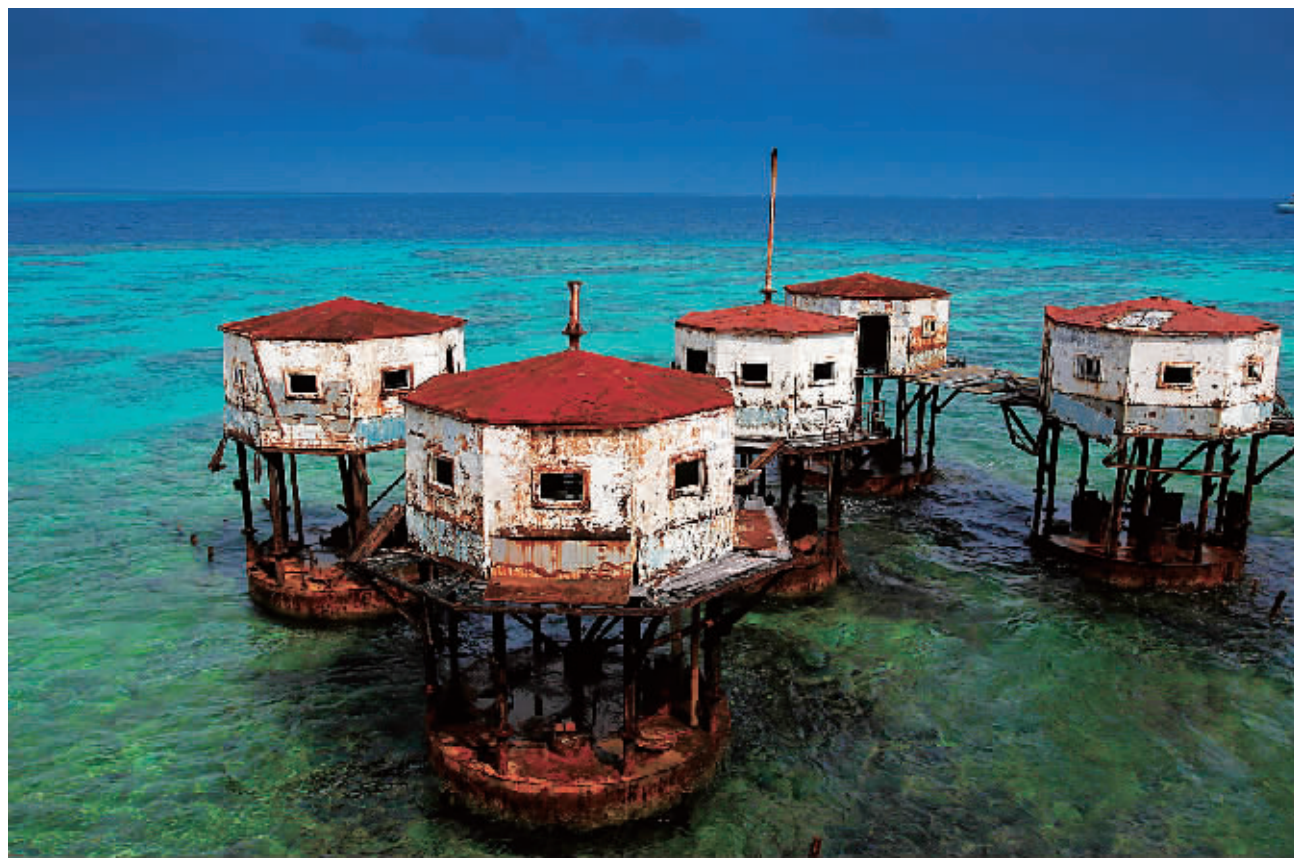
↑南沙美济礁的高脚屋。

这些作品拍摄时间的跨度长达60多年,空间跨度涉及西沙群岛、中沙群岛、南沙群岛的岛礁及其海域。创作者克服了重重困难和条件限制,采用了从空中航拍到航海拍摄等多样视角,既有在陆地上采风所得,也有大量潜水拍摄创作。展示的作品融新闻性、纪实性、艺术性于一体,堪称精品。本报从图片展500多幅作品中精选出一组刊登于此,以飨读者。