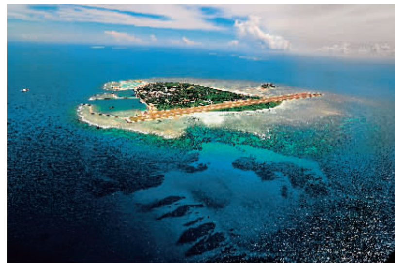
↑西沙永兴岛。