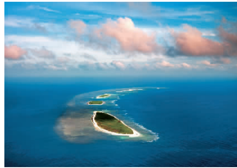
↑西沙七连屿。