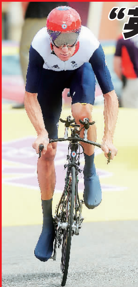
北京时间8月2日,在伦敦奥运会男子公路自行车个人计时赛决赛中,维金斯以50分39秒54的成绩夺冠。图为维金斯在比赛中。