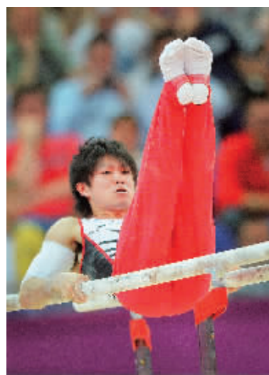
内村航平在双杠比赛中。

2008年,布莱克在电视上看着博尔特惊艳北京奥运会;而4年之后,他将迎来自己的奥运首秀。谈到经验不足的问题,这位新秀显然不以为意:“我很讨厌经验之说,经验对我不起作用;我就是要去赢得比赛。”