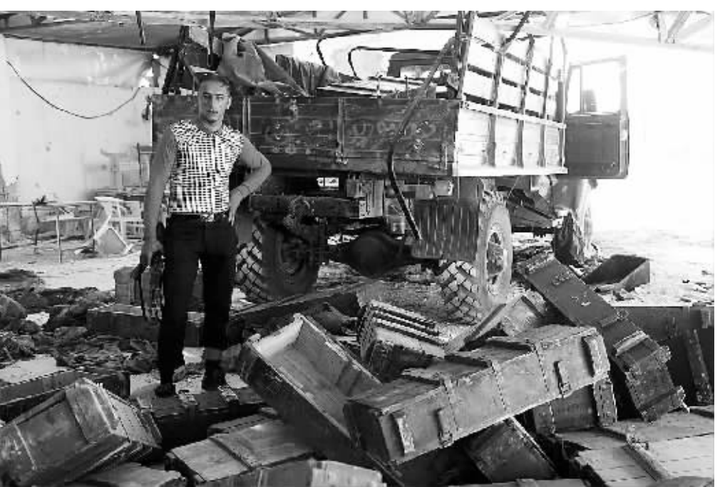
一名反政府武装人员站在空弹药箱旁。

危机的解决办法;流血冲突每延长一天,只会使危机的解决变得更加困难,给叙利亚带来更大痛苦,给整个地区带来更大危险。潘基文说,联合国仍然致力于通过外交斡旋结束暴力冲突,寻求由叙利亚人主导的、满足叙利亚人民合理诉求的解决方案。只有冲突各方坚决致力于对话,国际社会紧密团结给予支持,这项工作才可能成功。2012年2月16日,联合国大会投票通过了一份有关叙利亚问题的决议,呼吁联合国任命一位特使,为和平解决叙利亚危机进行斡旋,并通过提供技术和物质援助的方式,为阿盟处理叙利亚危机的努力提供支持。2月23日,联合国秘书长潘基文和阿盟秘书长阿拉比发表联合声明,宣布任命联合国前秘书长安南为联合国-阿盟叙利亚危机联合特使。